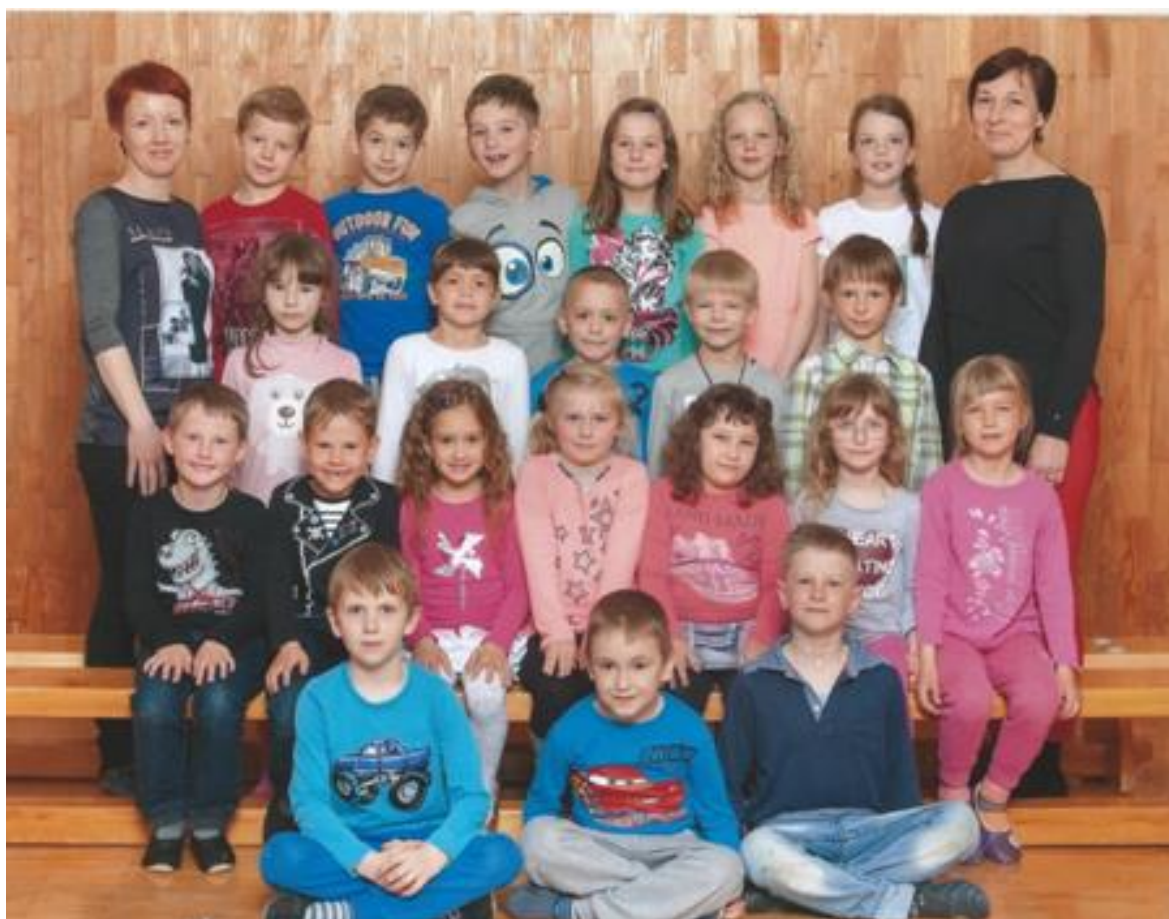
OŠ heroja Janeza Hribarja Stari trg pri Ložu podružnica Iga vas