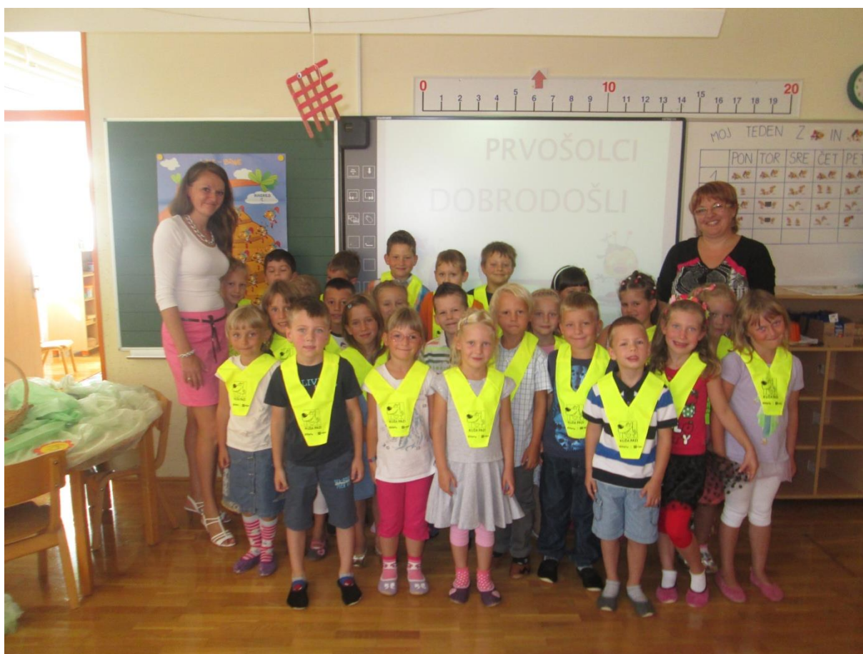
OŠ heroja Janeza Hribarja Stari trg pri Ložu